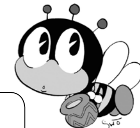
文科省生涯学習マスコット マナビィ

生涯学習とは 教育、文化、スポーツ、健康、福祉、環境、防災、産業、まちづくり等生涯を通じて行う様々な学習活動です。