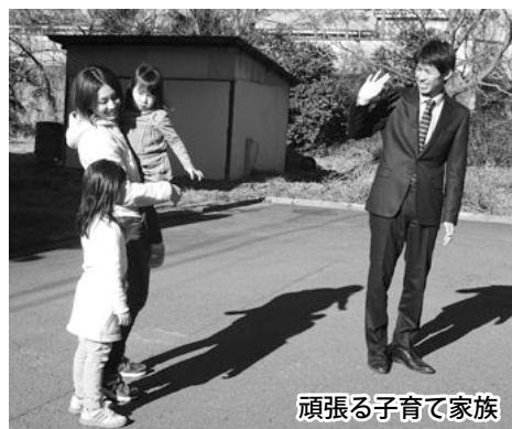
家族で子育て頑張る

子育て支援課長 3月に策定の「子ども・子育て支援事業計画 3 」をもとに、当該所管課が推進します。平成31年度目標の保育サービス「二時預かり保育は現在の2カ所を3カ所に、延長保育実施は4カ所を6カ所に、病児・病後時保育実施を1カ所」に取り組みます。計画策定に当たり、事前実施したアンケート（育児休業未取得で離職した女性47%）に