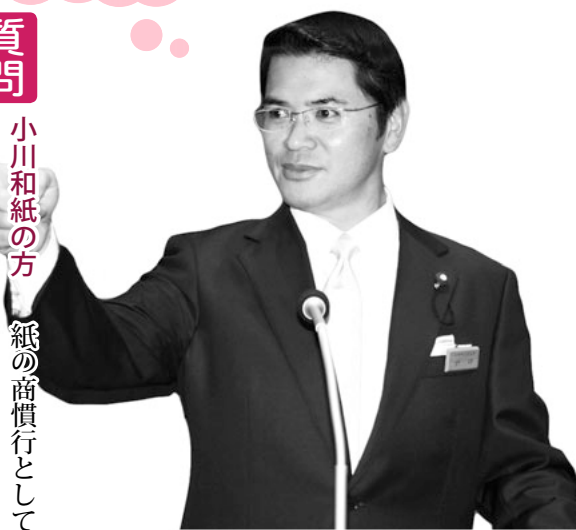
戸口 勝 議員