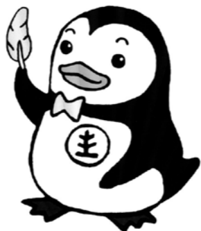
罪正へキンのがしんやん

毎年7月を強調月間として、各地でさまざまな取組がなされる「社会を明るくする運動」。犯罪や非行の防止と、罪を犯した人たちの更生について全ての国民が理解を深め、それぞれの立場で力を合せ、犯罪や非行のない安全・安心な地域社会を築くための運動です。