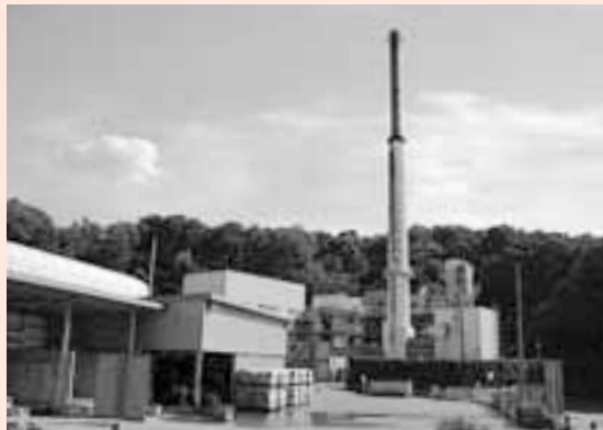
小川地区衛生組合ごみ焼却場

県統計課調べ)となり、協議を重ねています。正副管理者会議の協議の中で進展がなく、今後会議が持てないと報告がありました。