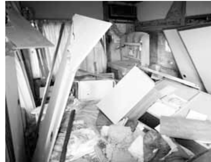
新潟県中越地震の被害状況