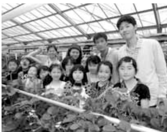
若者によるボランティア活動

答弁 政策推進課長 昨年末、県の県民生活部共助社会づくり課から担当職員を招き、商工会・社会福祉協議会・関係各課の出席のもと、説明会を開催しました。本事業については、既に実施している県内自治体の制度の仕組みや課題等をお聞きし、関係団体と協議を重ねながら実施に向けて取り組みま