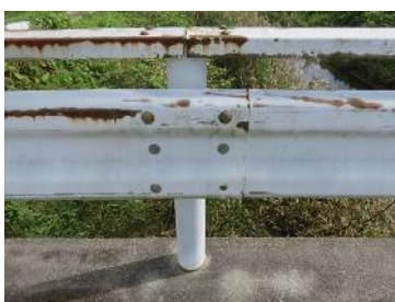
ガードレールの変形【II】