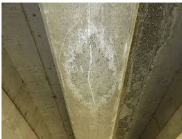
コンクリート桁のひびわれ【II】