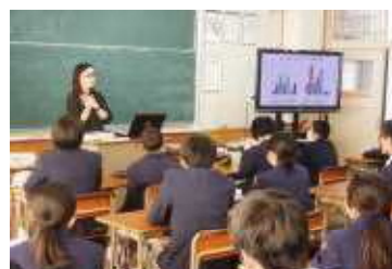
クラスメイトの「心の状態」 について確認します

皆さんは「ブレインストーミング」ってご存じですか? 直訳すると「ブレイン(脳)をストーミング(嵐状態にする)」ということです。具体的には、あるテーマに対して各自が頭に浮かんだことを思うがままに言い合います。お互いの自由奔放な発想からお互いのブレイン(脳)を刺激し合い、いろいろな意見が嵐のように吹き荒れながらさらに創造的なアイデアが出せるという考え方です。