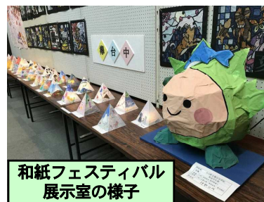
和紙フェスティバル 展示室の様子

「小川和紙の日(11月27日)」にちなんで、11月24日(日)、伝統工芸会館を会場に小川和紙フェスティバルが開催されました。和紙を利用した作品が町内小・中学校から出品され、本校生徒の作品(美術の授業で作成したもの)も多数展示されました。中でも、特に目を引いたのが和紙で作ったケヤップ(本校生徒会のシンボルキャラクター)です。