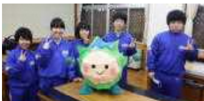
3Dの「張り子のケヤップ」完成! 制作を担当した総合文化部の皆さん

竹ひごで骨組みを作り和紙を貼った「張り子のケヤップ」は、かなりの時間をかけて総合文化部の皆さんが作成してくれました。途中、上手くいかなくて投げ出したくなったこともあったようですが、声をかけ合い、励ましながら、力を合わせて最後まで作り上げてくれました。