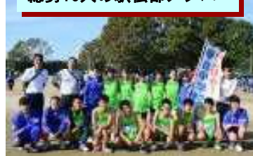
総勢16人の駅伝部メンバー