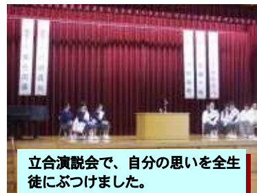
立会演説会で、自分の思いを全生徒にぶつけました。

10月16日(水)6校時の立会演説会、その後の投票の結果、会長候補者で最多得票生徒が生徒会長に、次点生徒と副会長候補で最多得票生徒が副会長に選出されました。そのうえで、10月25日(金)3校時に、当選した3名(校長が任命)と、生徒会長が委嘱した書記2名、会計2名の新本部役員メンバーの任命式が実施されました。