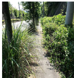
草が通せんぼ。 (8/20 午前中)

さて、どうしたものか…。役場に相談してみるか…。とっていたところ、8月20日(木)、21日(金)の2日間で、見違えるようにきれいに刈られていました。「小川町シルバー人材センター」の皆さんが暑い中、心を込めて作業してくださったようです。私が通った時間は、お昼休みだったようでお礼が申し上げられませんが、この場をお借りして御礼申し上げます。ありがとうございました。