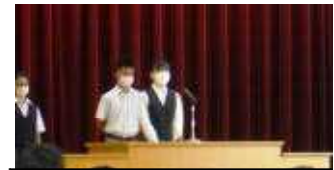
3年生 最上級学年、言葉に重みがあります。