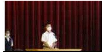
2年生 中堅学年としての自覚が感じられます。