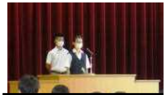
初々しい1年生 堂々とスピーチ。立派です。

きっと、生徒の皆さん一人一人が、この夏休みを、今後の生活を充実させる上での「充電期間」、「助走期間」にしてくれたのではないのでしょうか。これからも、皆さんの活躍を楽しみにしています。