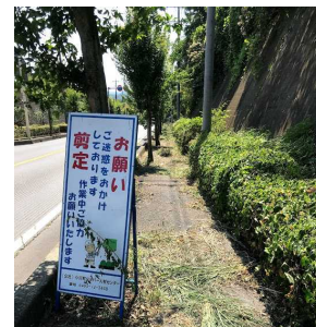
スツクリ。すいすい。 (8/21 午後)