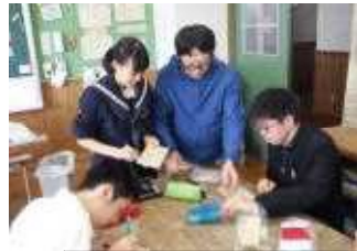
美術での作成の様子:集中して取り組んでいます

1年生は、木製パズル、2年生は石材彫刻、3年生は木彫オルゴール箱を作成しました。制作の過程から、生徒たちは集中して取り組んでいました。