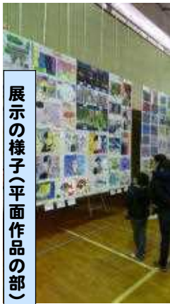
展示の様子(平面作品の部)

1月26日(土)に東松山市民体育館を会場に児童生徒美術展が開催されました。本校からも力作が多数出展され、会場はまさに巨大な美術館でした。