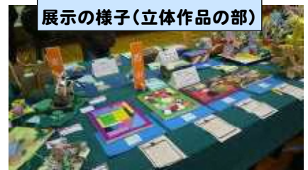
展示の様子(立体作品の部)