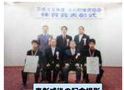
表彰式後の記念撮影