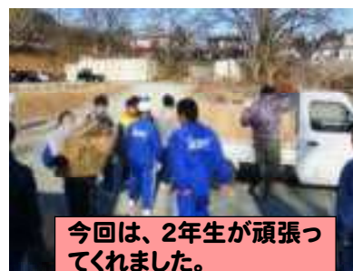
今回は、2年生が頑張ってくれました。

1月13日(日)素晴らしい青空の下、第2回資源回収が行われました。数日前の天気予報では雪マークもつくなど、開催が危ぶまれましたが、PTA役員の皆様をはじめ地域の皆様、保護者の皆様にご協力いただき、無事に開催することができました。