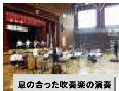
息の合った吹奏楽の演奏

全校生徒が様々な場面でその言葉どおり「有言実行」した素晴らしい行事となりました。私は、『一人一人が心を一つに「一瞬一瞬」を大切に創り上げる、西中学校の「彩」に染め上げて欲しい』とお願いしましたが、まさに、色とりどりの「彩」がちりばめられた最高の「はなのき祭」となりました。