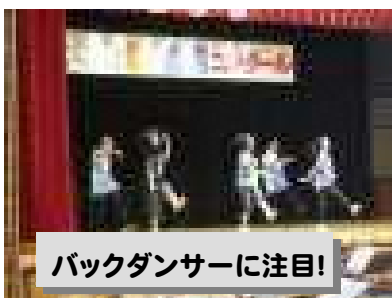
バックダンサーに注目!

まずは、ステージ発表です。3年生が引退して、1・2年生が中心となった新生吹奏楽部の迫力ある演奏を皮切りに、比企地区英語弁論大会に西中代表として出場した3年生〇〇〇〇さんの感情あふれる英語スピーチ (The Beauty of Perfect Harmony)。有志発表では、ダンスやピアノの連弾、コントで芸達者な西中生を再発見させてくれました。先生方の飛び入りダンスには、来賓の方々も拍手喝采でした。