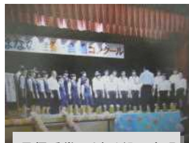
最優秀賞 3年1組の合唱

とアドバイスをいただきました。自分の声や周りの人たちの声を耳をすませて真剣に聴くこと、そして、一人一人が持っている音を重ねて、これからも楽しく歌っていきましょう。