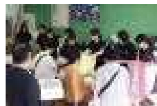
盛況だったバザー会場

昼食後は「合唱コンクール」。いよいよ、1学期から各学級で取り組んできた練習の成果の発表です。昼休みや放課後はもちろん、朝読書の前など時間を工夫して練習してきました。最優秀賞が3年1組、優秀賞が3年2組、優良賞が2年1組という結果でしたが、全てのクラスが練習の成果を十分に発揮した素晴らしい歌声を、体育館いっぱいに響かせてくれました。3年生は、勝って涙、負けて涙でしたが、どちらの涙もとても美しいものでした。小川班音楽会（10/17 3年2組出場）、西部北地区音楽会（11/20 3年1組出場）でも、思う存分に西中旋風を巻き起こしてください。