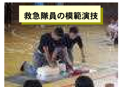
救急隊員の模範演技

今回、AEDの使用法に関しては、説明を聞くだけで演習はできませんでしたが、機会があったら身に付けたい人命救助の技術ですね。