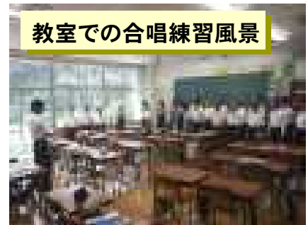
教室での合唱練習風景

保護者の皆様にも大勢足を運んでいただき、子供たちの活動をご覧いただきたいと思っています。よろしく願いいたします。