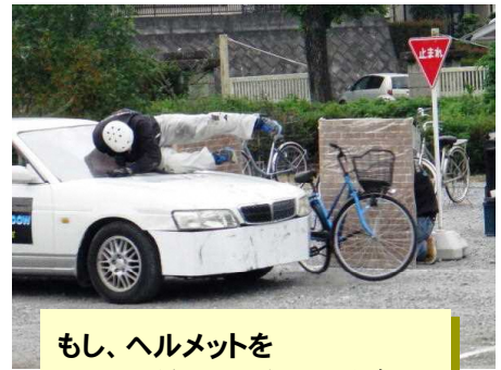
もし、ヘルメットをかぶっていなかったら・・・

9月7日（金）の6時間目に、自転車事故防止のための自転車安全教室を行いました。はじめに小川警察の方から埼玉県交通事故についての説明がありました。今年の埼玉県の交通事故者は、122名で全国ワースト2位、そのうち、自転車乗車中に事故で亡くなった方は31名。埼玉県が全国で最も多いとのことでした。「交通事故の多いとても危険な県に住んでいる」ということを忘れないでくださいと強調されていました。