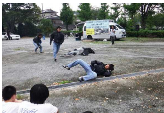
見ているだけで恐ろしい!

続いてシャドウ・スタントプロダクション（プロのスタントマン）による交通事故の再現です。時速40Kmの自動車が自転車と衝突したときの衝撃のすごさ、傘さし運転、スマホを見ながらの運転などの危険な行動がどんな事故につながるかなどを実演してくれました。自転車同士の衝突や自転車が歩行者を巻き込むような場合でも、大きな事故につながることを命がけで伝えてくれました。また、生徒代表7名が実際に車に同乗して事故の衝撃を体験しました。事故の怖さと、安全運転の大切さを強く感じてくれたようです。