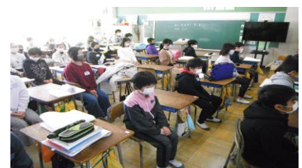
【3月11日 午後2時46分に黙とうをする5、6年生】