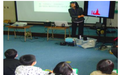
【講師の話を聞く児童】