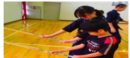
【本校卒業生がゲストティーチャーで指導】