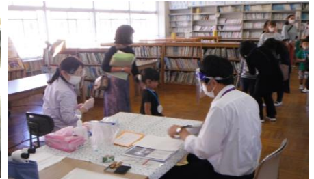
【眼科検診が終わり、ほっとしましたね】