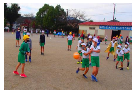
【ドッジボールで遊ぶ グループ】