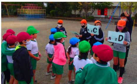
【6年生がメンバーを確認 をしています】

わくわくタイムは、休み時間などに学年の異なる児童で遊びを行っています。その活動には、ねらいがあり、①高学年児童のリーダーシップを育てる。②そのグループの児童同士が仲良くなる。③体力を高める遊びを積極的に取り入れて、遊びの中での体力向上を目指しています。