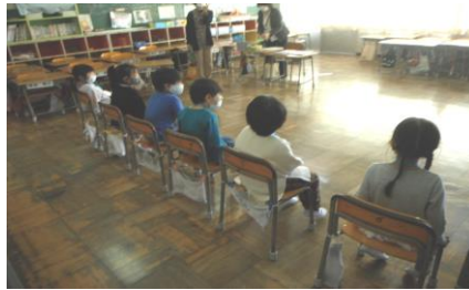
【検診を待つ園児の皆さん】