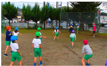
【「だるまさんが転んだ」 動かず止まれたかな】