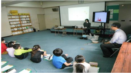
【2名の先生が来校してくださいました】

そこで、10月16日（金）に埼玉県立特別支援学校坂戸ろう学園の先生を講師に招き、4年生が福祉体験学習を行いました。