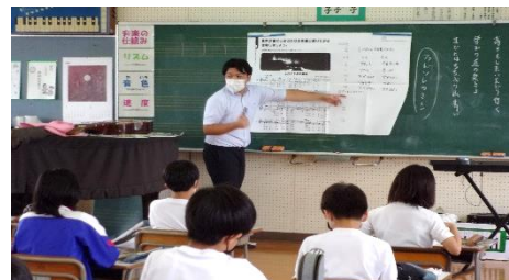
【4、5年生の授業参観の様子】