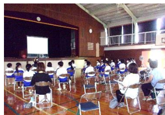
【6年児童と保護者の方が一緒に聞きました】

今年度は、参観日に合わせて実施でき、多くの保護者の皆様にご参加いただくことができました。今回の機会を利用していただき、ネット利用について、ご家族で話し合っってみてください。