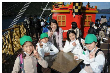
＜芦ノ湖を海賊船で遊覧＞