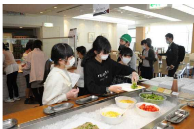
＜彫刻の森でバイキング＞