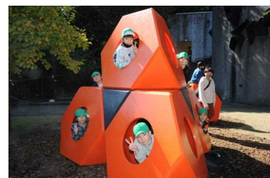
＜箱根彫刻の森美術館＞