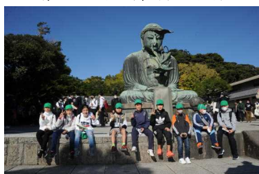
＜鎌倉大仏の前にて＞