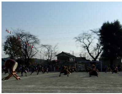
<3・4年 八和田ソーラン 2021>