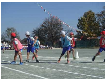
<つなげ！魂のバトン>