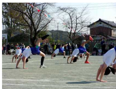
<5・6年 群青（組体操一人技）>