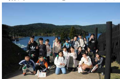
＜芦ノ湖で集合写真＞

そして、何より素晴らしかったことは6年生の皆さんが『欠席無し』『病人・けが人なし』で全日程を過ごせたこと、ルールを守り時間通りに全ての行程が進んだことです。保護者の皆様には、健康管理、荷作り準備、早朝のお見送り、夕方のお出迎え等、ご協力いただきましてありがとうございました。