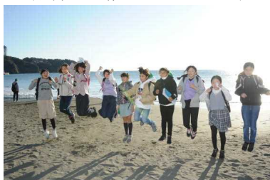
＜江ノ島海岸でジャンプ＞