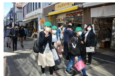
＜班別行動：小町通り＞