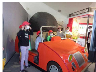
<環境科学国際センター>