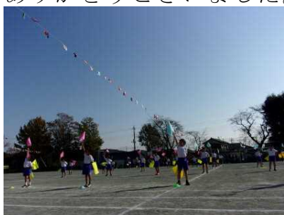
<1・2年 フラッグダンス>

運動会に際し、保護者の皆様には当日の検温・消毒等ご協力をいただきました事、感謝申し上げます。また、PTA 役員の皆様、ボランティアの皆様には、前日準備、校庭の環境整備から当日の準備・受付・後片付け等ご協力いただきありがとうございました。