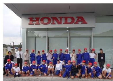
【(株)HONDA 寄居工場前での集合写真】