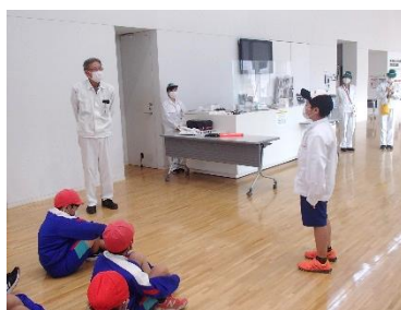
【お礼のあいさつをする児童】