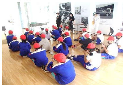
【工場見学に必要な無線の説明を受ける児童】

日本の輸出基幹産業の一つでもある自動車工業。実際にその製造現場を見ることで多くの知識を得ることができました。さらに、人々の知恵の素晴らしさと努力の偉大さ、長い時間をかけて先人から引き継ぎ積み上げた経験と資料の大切さ等、それらに改めて気づき、認識を深めることのできた一日となりました。 【工場内の写真は、多くの秘密事項があるため撮影の許可が下りませんでした】