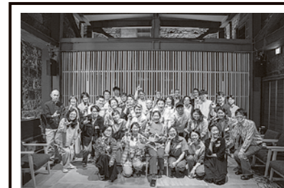
昨年(2周年)の記念イベントの様子

3周年記念として、10日(金)当日の夜には会員さんに向けて記念パーティー、翌11日(土)はすべての方に向けて開放日を予定しています。平日だとなかなか来ることが難しい方やどんな感じかちょっと見てみたいという方など、ぜひこの機会にお越しいただけると嬉しいです。