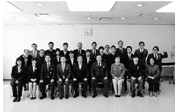
問合せ 政策推進課 地方創生担当 ☎②21