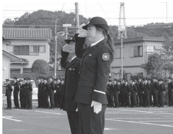
小川消防団特別点検