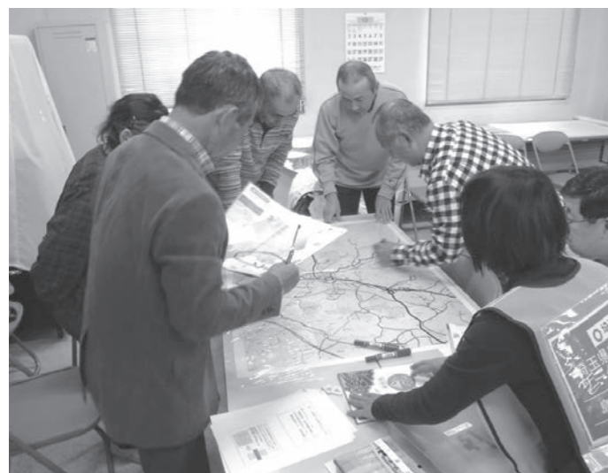
大塚二区での災害図上訓練講師