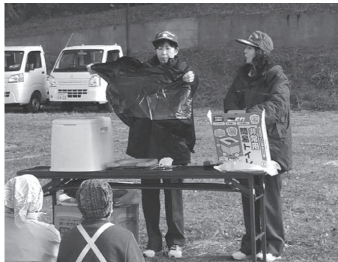
前高谷区での簡易トイレの説明