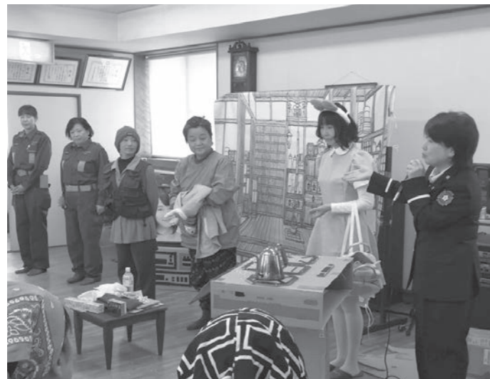
青上区での火災予防寸劇

小川消防団員130人の内、10人は女性団員です。平常時は、予防活動を中心に活躍しています。