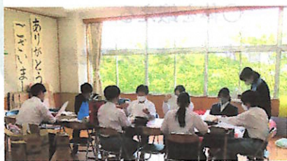
生徒会本部役員会

5月10日(水)に第2回生徒会専門委員会が開かれ、体育祭や募金活動など、皆さんが主体的となつてのよりよい学校づくりや行事づくりが本格的にスタートしました。生徒会本部と各専門委員会の皆さんが、連携・協力しながら、全校生徒一人一人が充実感や達成感を味わえるものにしていってください。