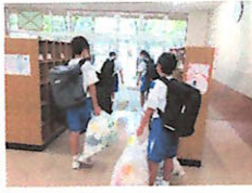
給食・美化委員会