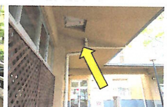
避難用はしご（3F 音楽室ベランダ⇒2F 視聴覚室ベランダ⇒1F 職員玄関前）