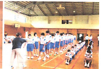
体育館への避難のようす