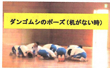
ダンゴムシのポーズ（机がない時）

※2つの階段から避難できない状況で、3階に取り残された時などに使用する避難用はしごが音楽室のベランダにあります。3階のベランダから2階の視聴覚室のベランダに降りられます。そして、さらに1階へと降りられます。非常時のためのものですので、平時には触れたり使用したりしないでください。