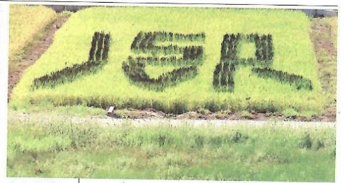
「150 八小」緑々しく 小川・八和田小で田んぼアート

今年6月中旬、小川町立八和田小学校(原喜佐江校長)の全校児童が学校近くの水田で挑戦した「田んぼアート」の稲穂が色づき、通行人ら目を引いている。 同校では毎年、学校応援の今村忠明さん(77)ら地元9家の協力で田植えを体験。年度は創立100周年で、めて「田んぼアート」を企画。デザインは「150 八小 埼玉新聞」黒米と「彩のかがやき」の2種類の苗を植え、数字「150」と文字「八小」の部分は黒米を植えた。 子どもたちの稲刈りは10月中旬に、150周年記念式典は来年2月9日に予定している、という。(磯田正憲)