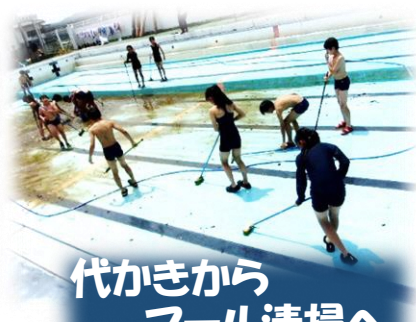
代かきから プール清掃へ